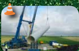
Projet Tramomarina 5 Turbines Senvion MM92 de 2 MW Raccordement prévu : 2015