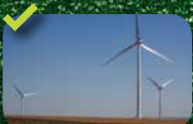
Centrale La Voie Romaine 11 Turbines Vestas V90 de 2 MW Raccordement : juin 2014