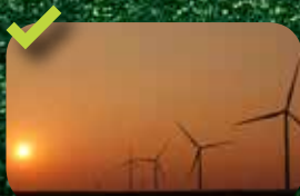
Centrale La Guenelle 11 Turbines Vestas V90 de 2 MW Raccordement : décembre 2013