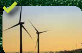
Centrale Montbray & Margueray 10 Turbines Senvion MM82 de 2 MW Raccordement : avril 2014